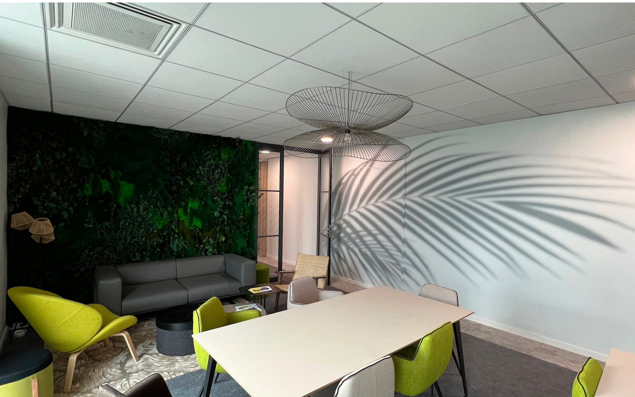
Visuel imprimé sur film adhésif