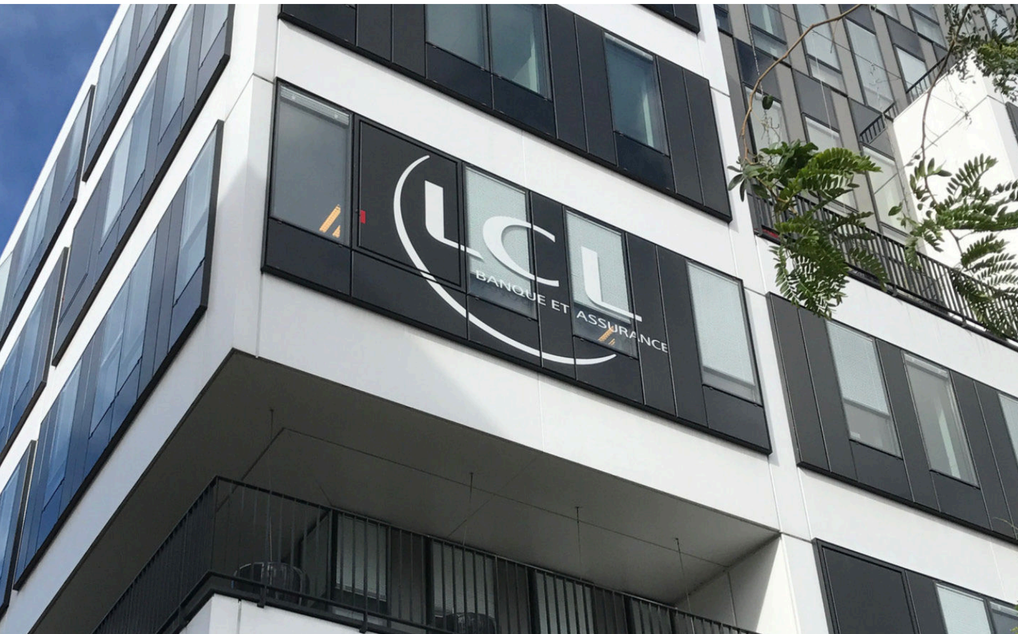
Enseigne adhésive extérieure